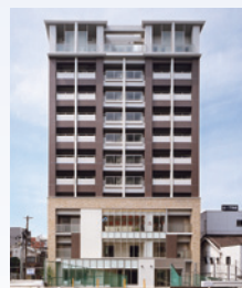
図1 画像診断 クリニック外観

1993年近畿医療技術専門学校放射線科卒業。社会医療法人きこう会多根病院、財団法人鳥潟免疫研究所鳥潟病院を経て、2008年から医療法人満領会画像診断クリニックに勤務。現在、診療放射線技師長。