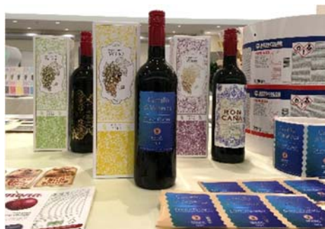
デジタル印刷したラベル・パッケージの例

コニカミノルタでは、デジタル化による多品種小ロット、短納期の実現と、印刷作業の効率化を助けるソリューションの提供により、産業印刷業界に新たな価値を提供し、事業拡大を図ります。