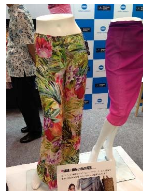
デジタル捺染の例

さらに、テキスタイル捺染（布印刷）では、欧州はアジアと並び世界のデジタル捺染市場の主要地域であり、壁紙や建材などの印刷にお