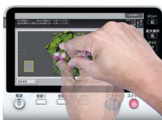
<ローテーション操作> 円を描く様な指の動きで、プレビュー画面を回転させることができます。