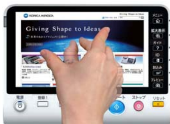
<ピンチイン/ピンチアウト操作> 2本指を開いたり閉じたりする動作により、画面の縮小/拡大が可能です。

複合機本体のボックスに保存した文書の編集や、プレビュー画像の拡大/縮小、回転等の煩雑なパネル操作もスマートフォンやタブレットと同様に複数の指で同時に触れるマルチタッチ UI の採用によって、より直感的で快適な操作性を実現しました。数字入力もパネル内で自由にドラッグ操作が可能なソフトウェアキーで行えます。