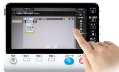
<ロングタップ操作> ドキュメントを指で長押し、アイコンにドラッグ&ドロップすることで操作できます。