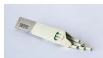
O' BON Newspaper 鉛筆