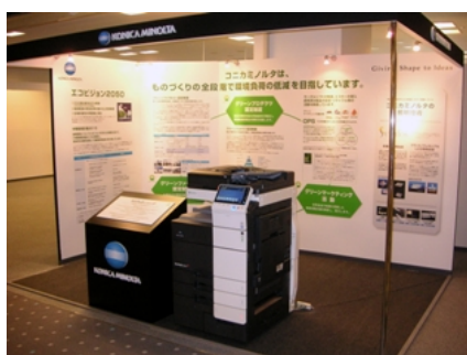
「おおさか ATC グリーンエコプラザ」展示

コニカミノルタグループは、事業活動を通じて地球環境の保全に取り組み、革新的な環境性能を実現する技術の創出によって社会的な課題の解決に貢献してまいります。また、世の中に支持され、必要とされる企業をめざし、地域社会の課題に応える活動をグローバルに展開しています。