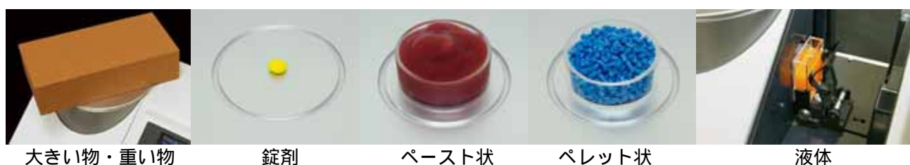
大きい物・重い物

トップポート型のデザインにより、秤のように測定対象物を載せるだけで簡単に測定ができる色計測機器です。反射と透過の双方が測定できるのはもちろんのこと、豊富なアタッチメントと工夫された構造により、1台で幅広い用途の測定ができます。シャーレなどの透明容器を使えば粉体や液体なども容易に測定でき、固体、液体、練り物、紛体、錠剤、あらゆる形状のものを、この一台で色管理できます。