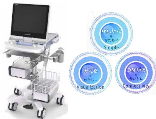
超音波診断装置 SONIMAGE HS1

お問合せ：コニカミルタジャパン株式会社 新規事業推進室 赤堀・中川 ☒ kmj-mbu@konicaminolta.com