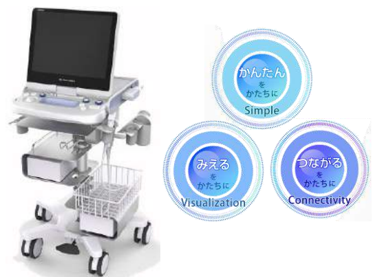
超音波診断装置 SONIMAGE HS1

お問合せ：コニカミノルタジャパン株式会社 新規事業推進室 赤堀・中川 ☒ kmj-mbu@konicaminolta.com