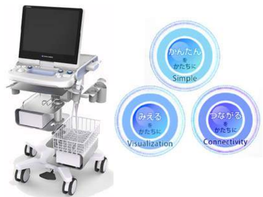
超音波診断装置 SONIMAGE HS1

お問合せ：コニカミノルタジャパン株式会社 新規事業推進室 赤堀・中川 ☒ kmj-mbu@konicaminolta.com