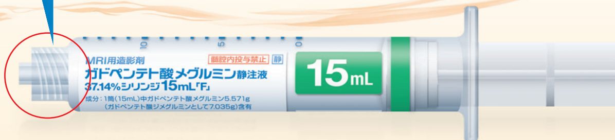
例：ガドペンテト酸メグルミン 15mLシリンジ