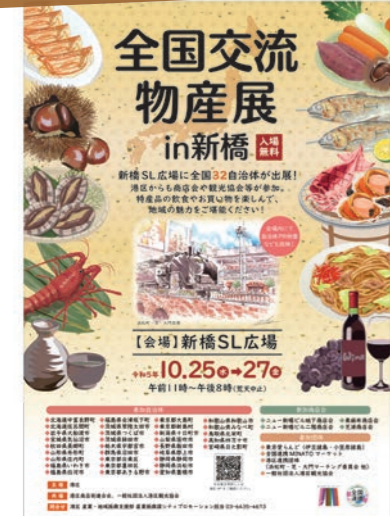
全国交流物産展in新橋のポスター