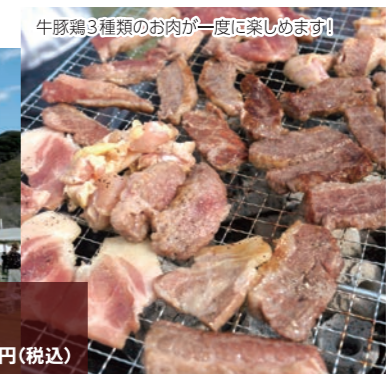
牛豚鶏3種類のお肉が一度に楽しめます!