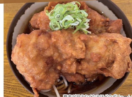
蕎麦が見えなくなるほどのボリューム感!! 表面はサクサク、中は肉汁たっぷりのジューシーな唐揚げです。唐揚げ単品は、そばつゆにつけて食べると最高、お持ち帰りもできます。