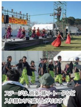
ステージは、音楽・踊り・トークなど入浴おめで盛り上がりです!