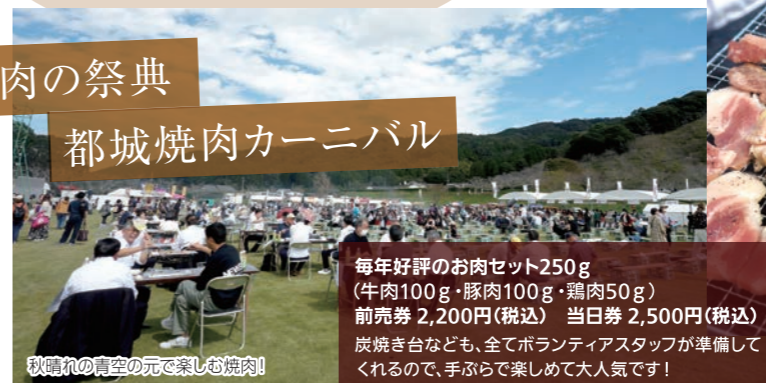
秋晴れの青空の元で楽しむ焼肉!

毎年好評のお肉セット250g (牛肉100g・豚肉100g・鶏肉50g) 前売券 2,200円(税込) 当日券 2,500円(税込) 炭焼き台なども、全てボランティアスタッフが準備してくれるので、手ぶらで楽しめて大人気です!