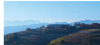
甲府盆地からは、ぶどう畑が見渡せます。

山梨県では多くの果物が作られており、フルーツ王国とも呼ばれています。特に「ぶどう」「もも」「すもも」は生産量日本一、4月には桃の花が甲府盆地をピンク色に埋め尽くし、初夏から秋にかけて、甲府盆地は収穫の季節を迎えます。シャインマスカットの旬は8月~10月です。ふるさと納税のご利用で旬の味覚をお楽しみください!