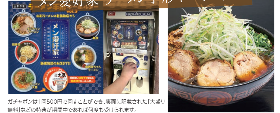
ガチャボンは1回500円で回すことができ、裏面に記載された「大盛り無料」などの特典が期間中であれば何度も受けられます。

株式会社大風印刷 TEL.023-689-1111 ガチャ設置店舗/えんどう本店、酒井製麺所、霞城セントラル1階(山形県観光物産協会)、山形市役所1階、イオンモール山形南、週末びっくり市 山形北店、ぐっと山形(株式会社 山形県観光物産協会)、移動ガチャ