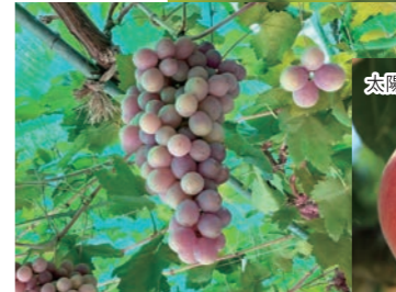
ぶどう狩りも好評です。