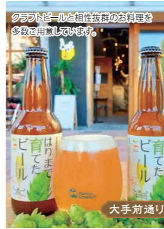
(左上) 姫路鳩屋麦酒 グランフェスタ店 (右) 姫路クラフトビール専門店 KOGANE