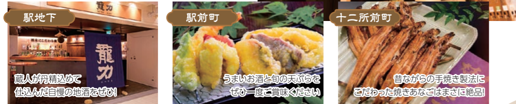
(左) 姫路の地酒「龍力」の直売店 (中央) 旬の天ぷらと季節料理 吉福(きちふく) (右) あなご料理 終(ひいらぎ)

播州の国はお城だけではなくありません。飲みもの食べものを味わってください。たくさんの酒蔵、話題の地ビールなどの酒文化、そして瀬戸内の魚やあなご。又、令和6年3月までは世界遺産登録30周年記念イベントが開催中です。