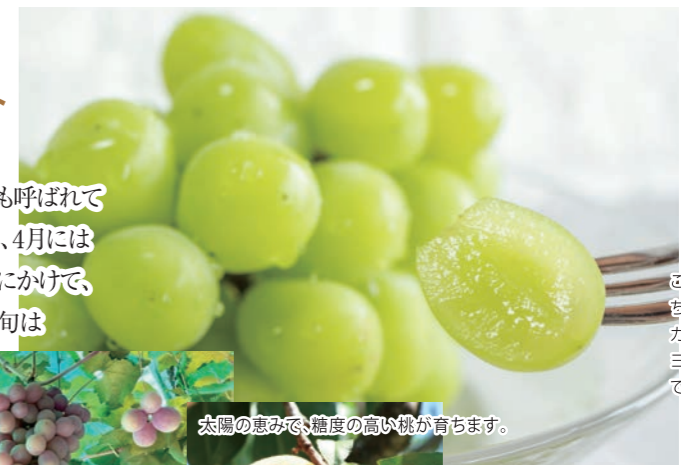
太陽の恵みで、糖度の高い桃が育ちます。