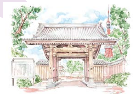
増上寺 旧方丈門（黒門）