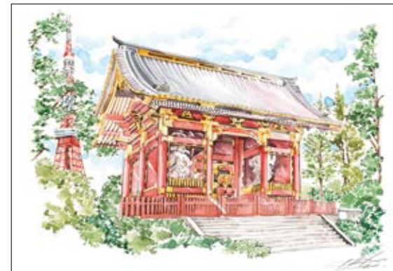
有章院霊廟（二天門）

湯島本郷百景を始めに、現在北海道から九州まで各地のマーチング委員会のイラストを手がけ、約2000点の作品にのぼる。