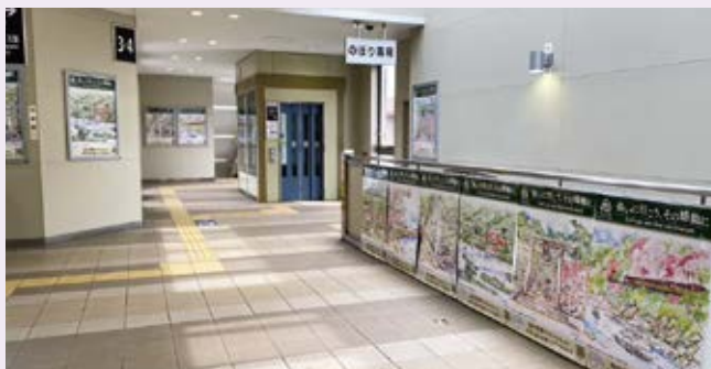
京都まちなみ百景のイラストを使用したポスターで駅構内を埋め尽くしました