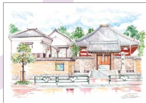
妙定院 熊野堂／上土蔵