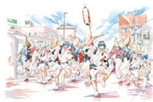
作品タイトル:七夕祭り阿波踊り 作家:上野 啓太

茂原の夏を彩る「茂原七夕まつり」は、昭和30年に商店街の振興を願って始まりました。色とりどりの飾りが街を埋め尽くし、関東三大七夕まつりのひとつとして多くの人でにぎわいます。さらに、市民有志による「茂原七夕まつり阿波おどり」は、笑顔と熱気に包まれる見どころのひとつ。世代を超えて踊り継がれるこの祭りは、人と人をつなぎ、茂原のまちに活気を届けています。