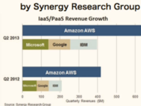
Amazon.com 年間総売上高推移

その大きさはIBM、Microsoft、Googleの3社の合計よりも大きく、そこへSalesforce.comの Force.comを加えてもさらに上回るほどの規模。この1年で市場は47%の成長を見せているがAmazonは 52% 成長、市場全体の 28% を占めている。