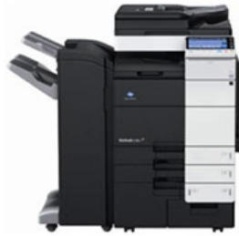
「bizhub C7541(オプション装着時)」