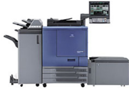
「bizhub PRO C6000L」(オプション装着時)