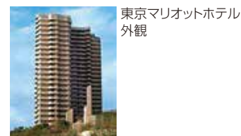
東京マリオットホテル 外観