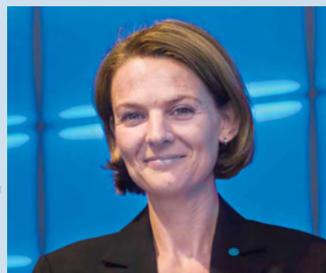
コニカミノルタビジネスソリューションズ ヨーロッパ インターナショナルマーケティングコミュニケーションズ マネージャー