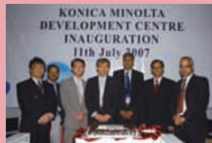
オフショア開発センターのオープニング

これらグローバル開発体制の構築によってソフトウェアの質的向上と効率化を図り、事業基盤の一層の強化を推進していきます。