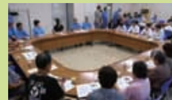
東京サイトでの地域環境報告会

地域の皆さまと双方向コミュニケーションを図ることを目的に、2007年9月に東京サイト（東京都日野市）と瑞穂サイト（愛知県豊川市）、10月に伊丹サイト（兵庫県伊丹市）において、「地域環境報告会」を開催しました。地球温暖化防止、廃棄物削減などの環境話題から交通安全への取り組みなど地域社会の話題にいたるまで、様々なご意見・ご質問をいただきました。