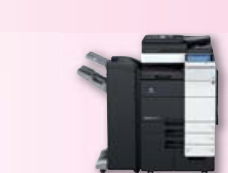
(2012年2月発売) オフィスドキュメント環境を 最適化するカラー複合機、 最上位モデル 「bizhub C754/C654」