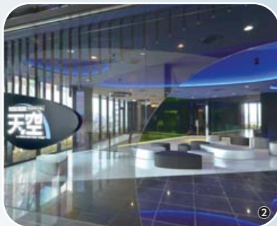
写真 ①プラネタリウム上映ドーム ②待ち合わせロビー(ホワイエ) ③東京スカイツリータウン全景