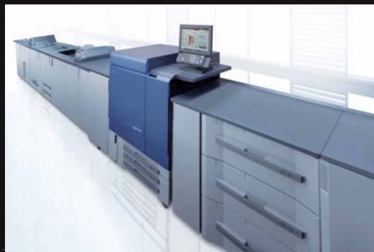
「bizhub PRESS C8000」

既存事業の強化に続く成長戦略として、当社が強みを持つ分野でコア技術を活かし、「既存事業の業容拡大」を目指していきます。具体的には、成長の見込まれる商業印刷分野において新製品「bizhub PRESS (ビズハブ プレス)」シリーズを新たに投入し、デジタルの特性を活かしつつ、オフセット印刷並みの高品質プリントによって、現在の商業印刷分野で主力のオフセット印刷の更新需要を取り込みます。また、光学技術を活用してLED照明分野への参入を果たし、デジタル家電以外の新領域に進出します。