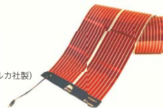
有機薄膜太陽電池 (サンプル製品・コナルカ社製)