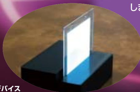
有機EL白色発光デバイス

コニカミノルタエムジー株式会社は、さらなる顧客サービスの向上を図るため、国内販売・サービス機能を統合し、国内メディカル事業の商品企画からサービスまでの機能を持つ新会社を設立しました。コニカミノルタが強みとしているデジタル画像読取装置などを中心に、医療・ヘルスケア分野でのリーディングカンパニーを目指して、新たなビジネスモデルに積極的に取り組んでいきます。