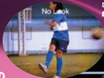
ロナウジーニョ選手 起用のテレビCM