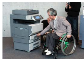
座った姿勢でもつかみやすい、上からも手が届く給紙カセットハンドル

実際の操作によるユニバーサルデザイン評価を繰り返し、下記の事例をはじめとする多くのきめ細やかな対応により、製品の操作性を向上させています。