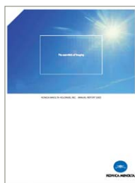
アニュアルレポート