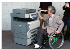
低い視点から見やすいように角度を簡単に変えられる操作パネル