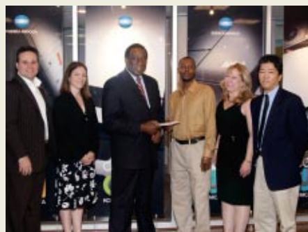
米国赤十字社への寄付

同基金は、2010年1月に発生したハイチ地震で被災された方々の支援のため、緊急の義援金募集を行いました。これに応じて従業員から寄せられた義援金に会社からの寄付を加えて、計31,500ドルを米国赤十字社に寄付しました。