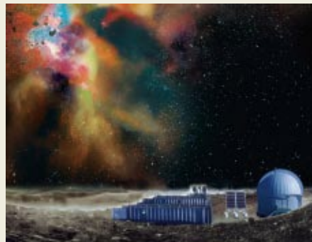
「遙かなる銀河へ TAO計画が迫る最新宇宙」