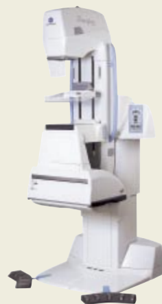
早期乳がんのサインである微細な石灰化や腫瘤影を鮮明に抽出する乳房X線撮影装置「Regius PureViewタイプM」

さらに、コニカミノルタをはじめとする日系企業7社が発起人となって、2008年10月、上海で「乳腺早期診断プロジェクト」を開始しました。これは、乳がんの発症率が高い35歳以上のホワイトカラーの女性従業員を対象に、各社が費用を負担して診断を実施するものです。初年度は8社から172名が受診し、再検査となった3名のうち1名が手術を受け、順調に回復しています。2009年度には上海と北京で実施し、10社319名が受診しました。今後も多くの企業に参加を呼びかけ、活動を拡大していきます。