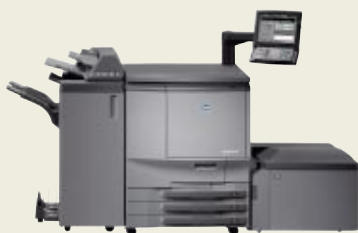
「高彩度トナー」により鮮やかな色再現が可能な デジタルカラー複合機「bizhub PRO C65hc」

ポーランドの情報機器販売会社であるコニカミノルタビジネスソリューションズポーランド社は、視覚障がいを持つ子どもとその家族の支援団体「レインボー」が推進するプロジェクト「United by Colour」に2007年から協力しています。このプロジェクトは、弱視の子どもたちの治療に役立つカラー教材の制作を目的としたもので、2009年度には専門家の助言のもと、鮮やかな色やパステル調など6種類の教材を新たに制作しました。今後、デジタルカラー複合機「bizhub PRO C65hc」で印刷し、配布する予定です。