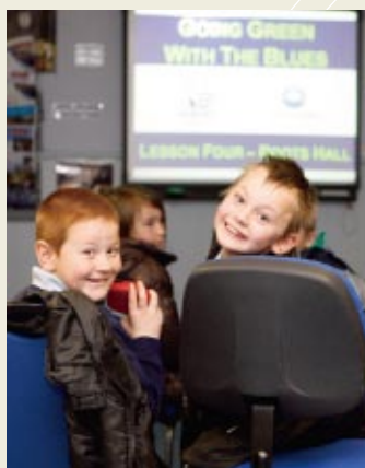
環境授業を受ける子どもたち

こうした取り組みに対し、同社は2009年11月、「グリーンアップル賞」を受賞しました。この賞は、世界的な非営利環境団体「グリーン機構」が環境取り組みの優良事例を表彰するものです。なお、同社は2010年度にはさらに30校でこのプログラムの実施を計画しています。