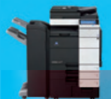
カラー複合機 「bizhub C754」

デジタル・ネットワーク化の進展を背景に、複合機やプリンターなどの情報機器は、日々のオフィスワークを支える重要なインフラとして存在感を高めています。コニカミノルタの複合機「bizhub (ビズハブ)」は、業務効率化、コスト削減や環境負荷低減、セキュリティ強化など、お客様のオフィスにおける課題解決のためのさまざまな機能を搭載しています。