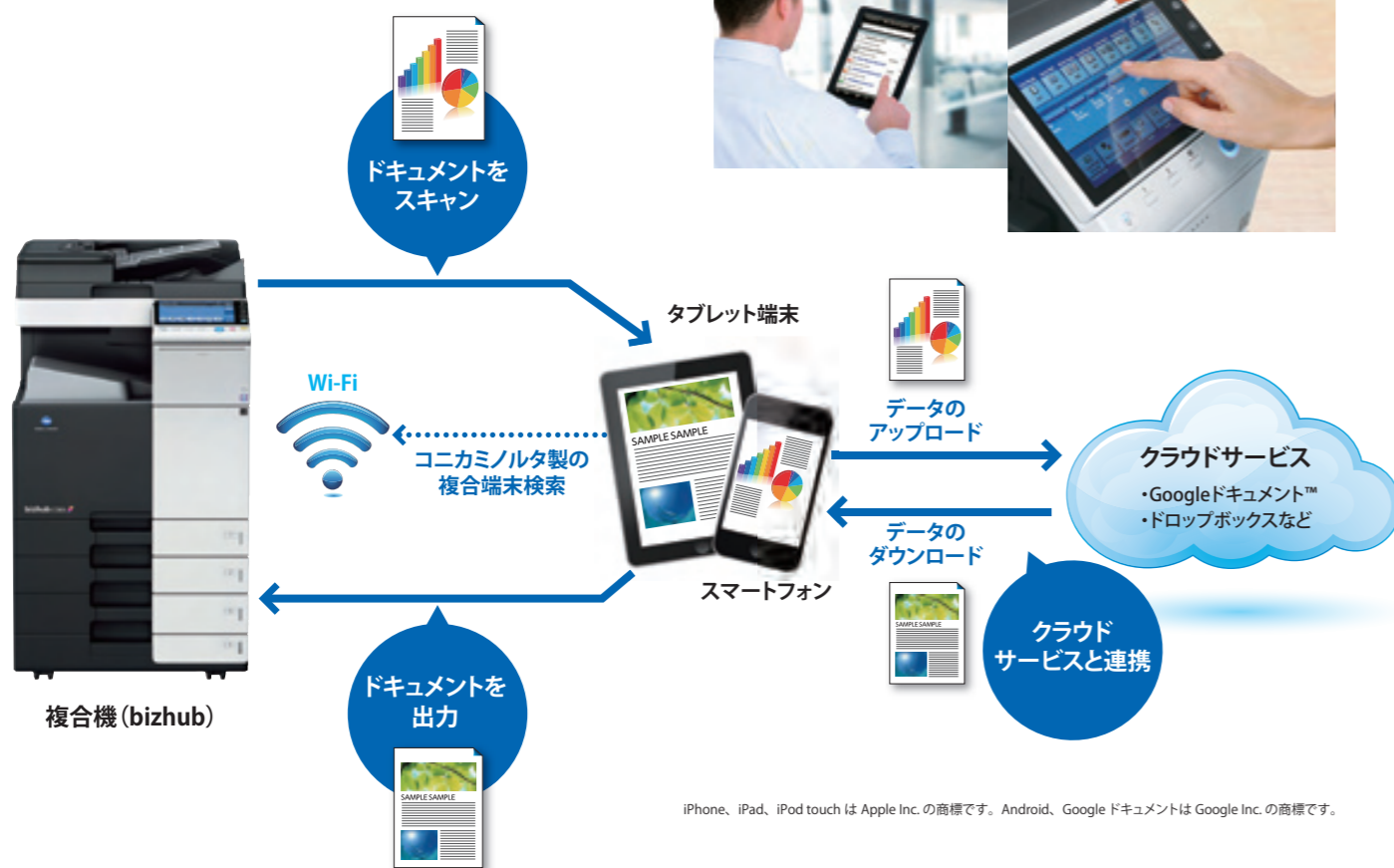
bizhubとスマートフォンやタブレット端末との連携

iPhone、iPad、iPod touchはApple Inc.の商標です。Android、GoogleドキュメントはGoogle Inc.の商標です。