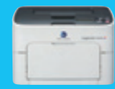
カラーレーザープリンター 「magicolor 1650EN」